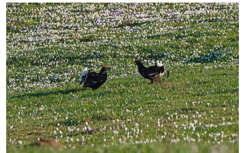
Birkhühner zählen zu den Leitarten des Naturwaldreservats.