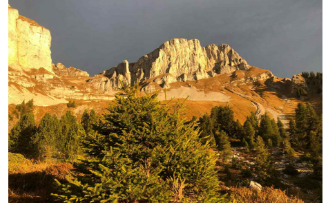
Hohgant/Furggütsch im Novemberlicht.