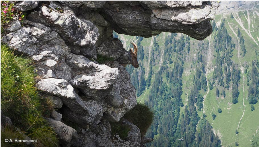
Ein Steinbock untersucht seine Umgebung.

Das Wald-Klimaschutzprojekt in der Region Beatenberg-Habkern in der Schweiz unterstützt die Umsetzung und Kontrolle eines Naturwaldreservates. Durch den vollständigen Verzicht auf die Nutzung des Holzes kann sich der Wald ungestört entfalten, der Atmosphäre mehr CO 2 entziehen sowie vielen Tier- und Pflanzenarten einen ruhigen, ungestörten Lebensraum bieten. Zudem helfen Wälder, Schadstoffe aus der Luft und im Boden zu filtern und tragen somit zu mehr sauberem Wasser bei.