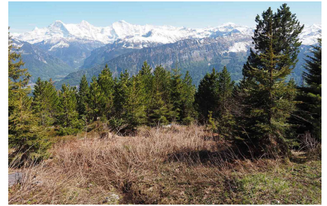
Gemmenalphorn: Blick Richtung Berner Alpen.

Erfahren Sie in unseren FAQ, wie myclimate diese SDGs ausweist.